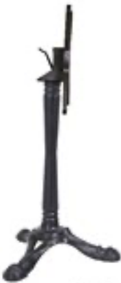
Montmartre Ligne Vauzelle ®

Plateau"COMPACT SURFACE AVANTAGE Ch.Noir"- Ep10- Ch Droit? Arrondi?