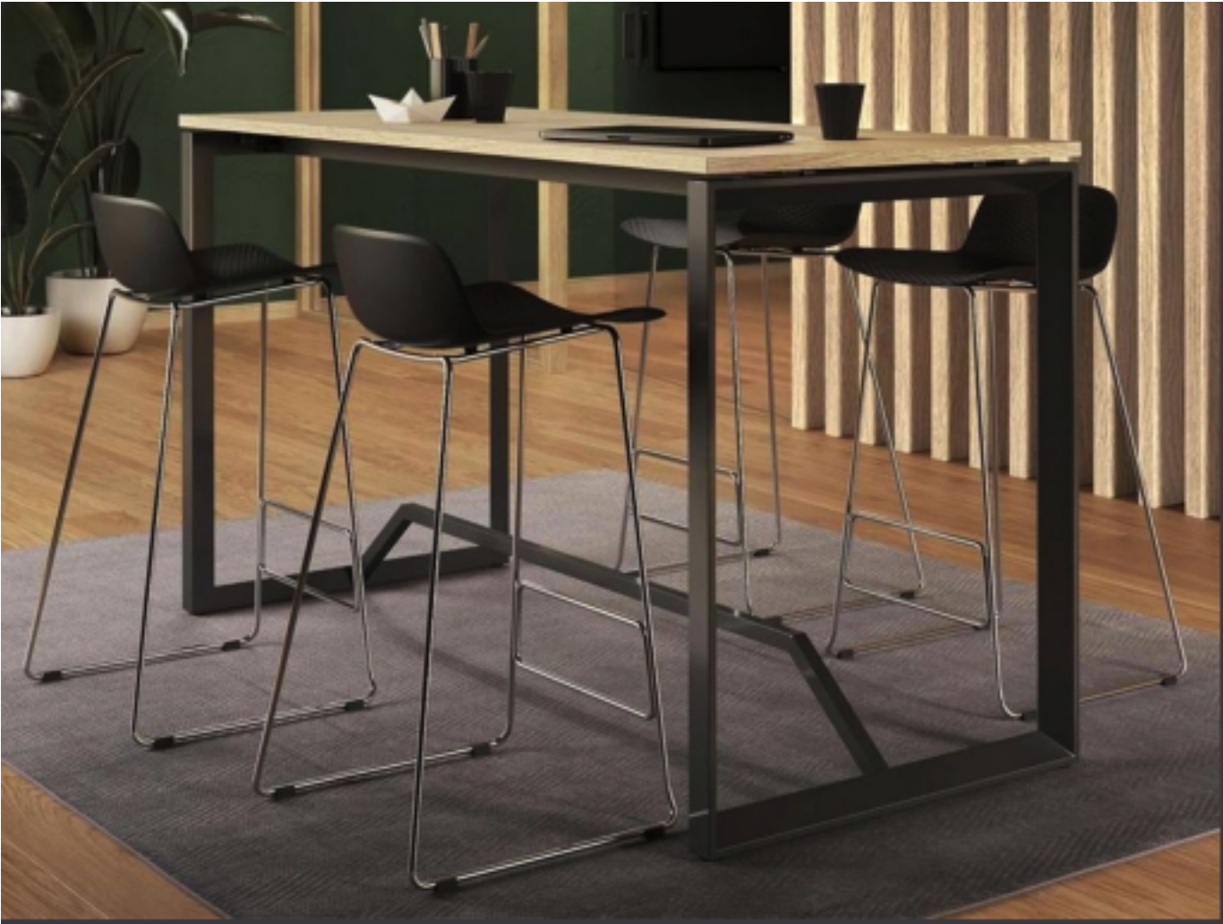
TABLER CO- WORKING , STRUCTURE ACIER , FINITION EPOXI GRIS ANTHRACITE PLATEAU IDEM KITCHENETTE COMPACT BOIS Chêne Scandinave 120x 70 h 110 quantité 3

références Vauzelle ou similaire , qualité collectivités grand passage